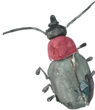
福光美術協会長賞 『源氏ホタル』 福野中学校 金 延厚