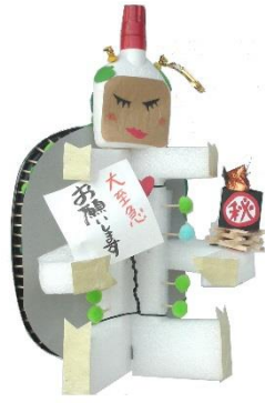
ムシ送り大賞 『今から聖火台 発虫』 射水市 中陳 岩夫